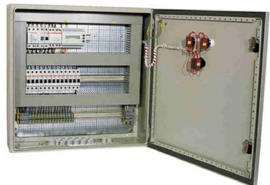
Ausführung DV 40 bis DV 100 Stahlblechschrank, IP 54