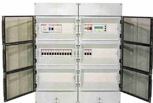
Ausführung DV 5 bis DV 30 Isolierstoffgehäuse, IP 65

In der Verteilung sind neben dem Regler die erforderlichen Schalt- und Schutzeinrichtungen nach den einschlägigen VDE-Bestimmungen, bzw. den Anschlussvorschriften des zuständigen Energieversorgungsunternehmens (EVU) vorzusehen.