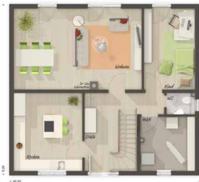
EG Variante 6 Zimmer