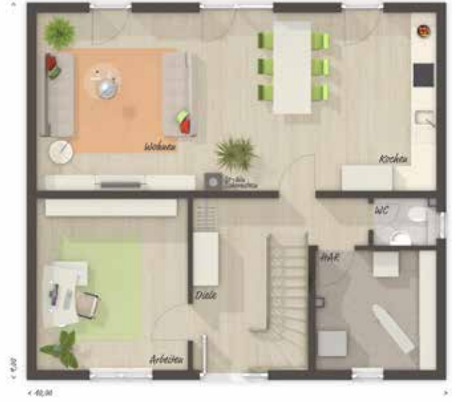
EG Variante mit offener Küche