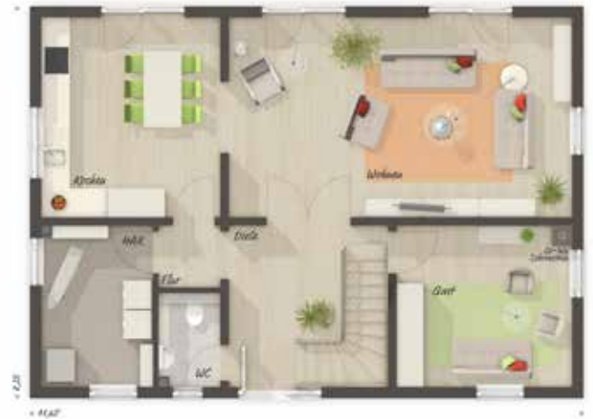
EG Variante 6 Zimmer