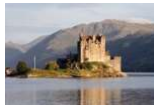
Eilean Donan Castle