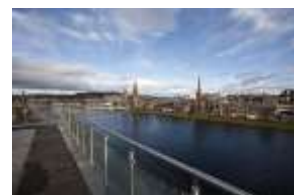
3* Hotel Inverness

Im Zentrum von Inverness, nur 5 Gehminuten von der High Street entfernt und mit Blick auf den River Ness, ist das Hotel der ideale Ausgangsort um Inverness, aber auch die Highlands zu entdecken. Die geräumigen Zimmer bieten einen Schreibtisch, einen Flachbild-TV und Kaffee-/Teezubehör.