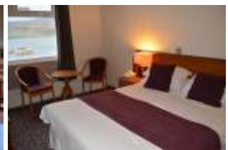
3* Hotel Portree

Lassen Sie sich nach dem Dinner im Hotel von der besonderen Atmosphäre Portree`s anstecken.