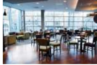
Hotel in Aberdeen

Das Hotel liegt direkt neben dem Einkaufszentrum Union Square und dem Bahnhof Aberdeen, nur 5 Gehminuten von den Geschäften, Bars und Restaurants der Union Street entfernt. Das Frühstück wird im stilvollen Restaurant serviert, das auch ein internationales Abendmenü bietet. In der modernen Hotelbar genießen Sie ein Getränk in ungezwungener Atmosphäre oder ein leichtes Mittagessen. Frischer Costa Kaffee und Tee werden ebenfalls im Loungebereich serviert.