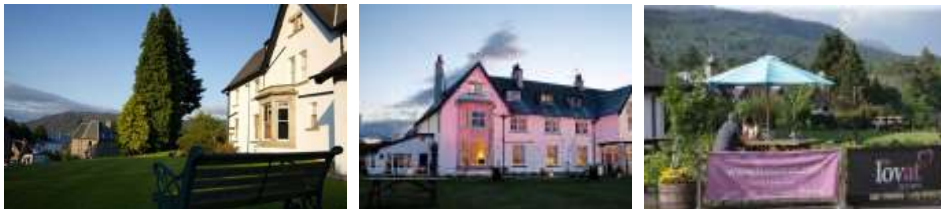
4* Hotel Fort Augustus

Nach einem Besuch eines der Loch Ness Exhibition Centre fahren Sie weiter nach Fort Augustus, wo Sie die kommende Nacht in einem 4*Hotel wohnen werden.