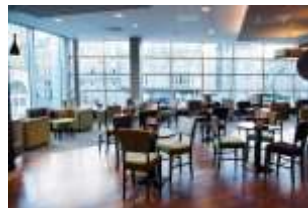
Hotel in Aberdeen