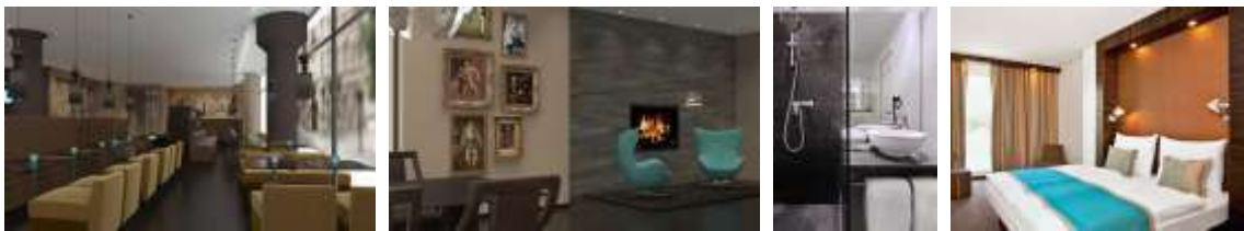
3* Hotel London

1. Tag : Anreise im Laufe des Tages nach London . Nach Ihrer Ankunft in Gatwick oder alternativ Heathrow werden Sie bereits von Ihrem deutschsprachigen Tourguide empfangen. Starten Sie Ihren London Trip mit einer Stadtrundfahrt.