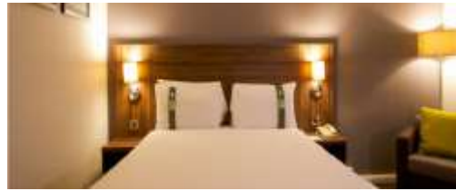
Hotel Liverpool Albert Dock

5. August : Heute steht der Tag im Zeichen der Beatles . Besuchen Sie zunächst das Beatles Museums. Nicht nur Musikliebhaber und Beatlesfans kommen hier auf ihre Kosten. Die Beatles Story am Albert Dock, nur eine Meile von Ihrem Hotel entfernt gelegen, ist beeindruckend gestaltet. Ein Audioguide leitet die Besucher durch das Museum. Von den Anfängen der Beatles, über die Jahre im Cavern Club und Hamburg, bis hin zur Beatlemania wird nichts ausgelassen.