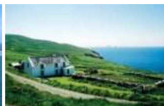
Ring of Kerry