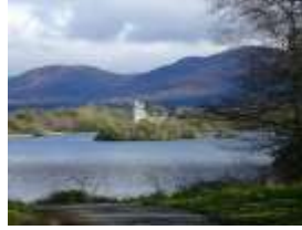
Killarney National Park