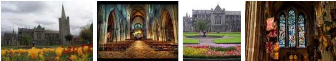
St. Patricks Cathedral

Besuchen Sie die St. Patrick's Cathedral , die 1213 erbaut wurde und heute die größte Kathedrale ist. Das Gotteshaus steht neben einer heiligen Quelle, an der der hl. Patrick um 450 n. Chr. zum Glauben Bekehrte getauft haben soll