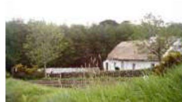
Muckross Traditional Farms

13. August : Heute fahren Sie den Ring of Kerry oder auf irisch, den Mórchúaird Chiarraí entlang. Diese 179 km lange Panoramaküstenstraße im County Kerry, die von Bussen wegen der Enge übrigens nur in einer Richtung, gegen den Uhrzeigersinn, befahren werden kann, ist ein Highlight Ihrer Irland Reise und führt Sie von Killarney über Killorglin nach Kells, Waterville und Kenmare zurück nach Killarney. Während der gesamten Rundfahrt hat man unglaublich spektakuläre Aussichten auf das Meer, auf kleinere und größere Inseln und malerisch zerklüftete Steilküsten. Aber auch wer das grüne, mit Steinmauern und Felsbrocken übersäte Inland Irlands liebt, ist auf dem Ring of Kerry genau richtig. Idyllische Weiden mit zahlreichen Schafen und Kühen, aber auch verlassenenes Ödland auf den Bergen hat seinen eigenen Charme.