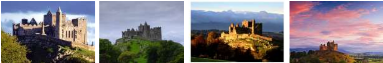
Rock of Cashel

Schon im 5. Jahrhundert erhob der heilige Patrick Cashel zum Bischofssitz. Im 12. Jahrhundert entstand mit Cormac's Chapel eine der schönsten Kirchen der Insel, erbaut im romanischen Stil.