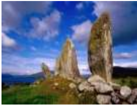
Steinreihe von Eightercua

Für einen Stopp unterwegs gibt es viele Möglichkeiten, so z.B. bei der Steinreihe von Eightercua, die eine der grössten Steinreihen Irlands ist und bei Waterville liegt.