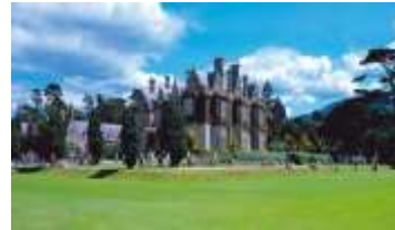
Muckross House and Gardens

Inmitten des Killarney-Nationalparks liegt Muckross-Haus , ein viktorianischer Landsitz und eines der schönsten Herrenhäuser in Irland, das in den Jahren 1839 bis 1843 nach Plänen des berühmten schottischen Architekten William Burn am Ufer des Lake Muckross errichtet wurde. Die elegant eingerichteten Räume zeugen von der Lebensweise der Großgrundbesitzer; im Untergeschoss dagegen kann man sich über die Arbeitsbedingungen der Bediensteten des Hauses informieren. Die Gartenanlagen des Hauses sind weltweit für ihre Schönheit bekannt. Besonders bemerkenswert sind die herrlichen Sammlungen von Azaleen und Rhododendren, der weitläufige Wassergarten und ein Steingarten, der aus dem natürlichen Kalkstein herausgehauen ist. Muckross-Haus beherbergt auch mehrere Handwerker, die traditionelle Verfahren in der Kunst der Weberei, Buchbinderei und Töpferei vorführen. Ebenfalls auf dem Gelände befinden sich die Muckross Traditional Farms . Hier wird das tägliche Leben der irischen Landbevölkerung in den 1930er und 1940er Jahren gezeigt.