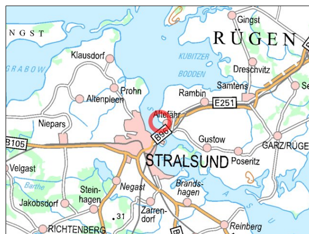
Kartenmaterial: © GeoBasis-DE/MV 2019; © Landesamt für Umwelt, Naturschutz und Geologie Mecklenburg-Vorpommern