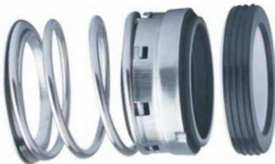
Maßtabelle Typ 11-2 mm und Zoll